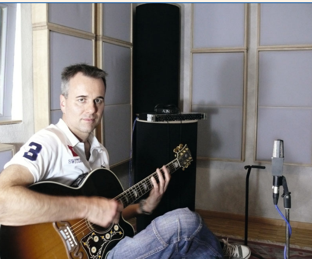
Der komplett absorbte, also trockene Raum wird normalerweise für Sprachaufnahmen verwendet. Für Instrumente ist er weniger geeignet.

tert die Details: „Die AKGs sind auf Kugelcharakteristik eingestellt, denn es geht schließlich darum, möglichst viele Rauminformationen einzufangen. Als Vorverstärker nehme ich den RME Octamic, wobei ich den Ausgangspegel ein wenig angepasst habe. Da die Gitarre leiser als die Perkussions-Instrumente ist, habe ich dafür einen etwas höheren Ausgangspegel eingestellt. Damit ergeben sich wirklich vergleichbare Einzeltakes.“