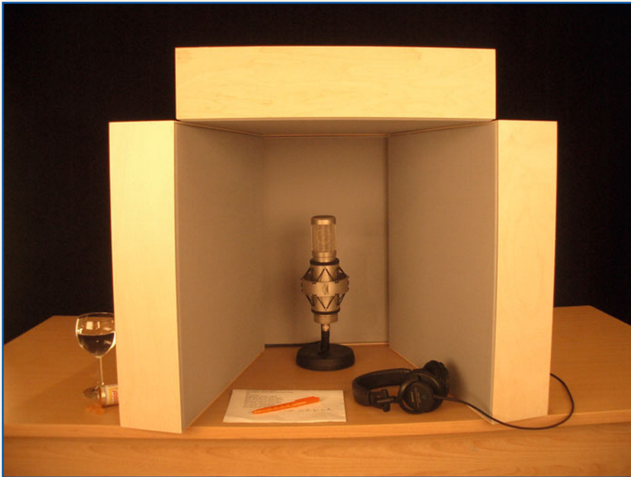
Mit vier HOFA-Absorbern lässt sich auch zu Hause schnell eine Sprecher-Kabine improvisieren.

Mixarchitektur zu betreiben. Der Tonschaffende erhält auf diese Weise eine räumliche Dimension, die mit dem Hallgerät nur sehr schwer künstlich herzustellen ist. Sachse: „Beispielsweise Schlagzeug: Wer eine Snare auf einer aktuellen Produktion hört, der hört nicht nur den Klang, den das oder die Snare-Mikrofone aufzeichnen. Genauso wichtig ist der Anteil der Overheads. Die nehmen einerseits die Snare mit auf, andererseits erfassen die sehr viel vom Raum. Mit anderen Worten: Der Raum macht