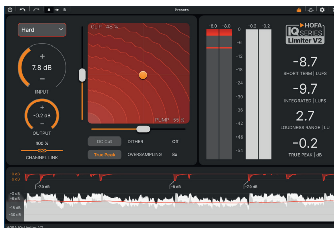
Einfach zu bedienen: IQ-Series Limiter V2

HOFAs neuer IQ-Series Limiter V2 ist ein modernes Mastering-Tool, das mit vielen innovativen Features punktet. Mit diesem Plug-in erzielt ihr im Handumdrehen exzellente Ergebnisse. Trotz der vielfältigen Einstellungsmöglichkeiten ist die Benutzeroberfläche des neuen Limi-